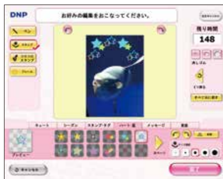
お絵かき入力画面