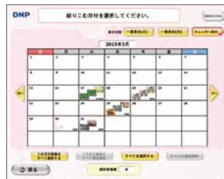
画像絞り込み画面(カレンダー)