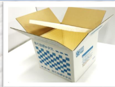
保冷ボックス用途

* ERは厚み・密度によって変化しますが『グラスウール32K』と同等レベルの断熱性能がごございます。